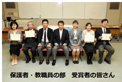
保護者・教職員の部 受賞者の皆さん