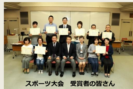
スポーツ大会 受賞者の皆さん

☆ソフトボール大会 (11/11) 優勝 上巻分方小 準優勝 第二小 山田小 合同チーム 三位 上川口小