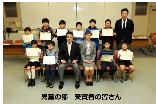
児童の部 受賞者の皆さん

八王子市長賞 はらでても かみがなくても パパヒーロー 八王子市教育長賞 ママピンチ ベルトなくても パパ変身 八王子青年会議所理事長賞 ヒーローは だれでもなれる なれるはず 八王子市立小学校校長会会長賞 ぜったいに あきらめないぞ バイキンマン 優秀賞 ヒーローは おれだおれだよ たすけるぞ ゆめのため 転校した君 がんばれよ にが手なこと 少しできたら もうヒーロー パパすごい えんじんうごかし なんきょくへ ヒーローに なるためふっくん 百億回 ウルトラマン もうちょっと長く たたかって