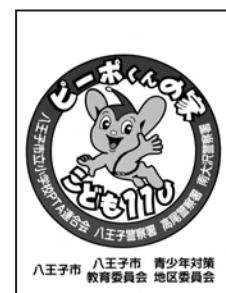
▲「ピーポくんの家」ステッカー

「ピーポくんの家」の選定・設置・児童への周知は、各単位PTAなどが行います。設置された家庭や事業所には、見やすい場所に「ピーポくんの家」ステッカーを掲示していただきます。