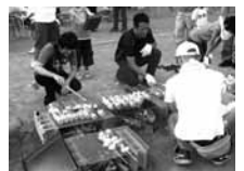
アイデアいっぱいの楽しいイベントが盛り沢山！

ーツポンチなどの食事で親子に楽しんでもらいました。漢たちは待つていたのです。そして、やれば出来ることを知りました。今年もいろいろ挑戦します。