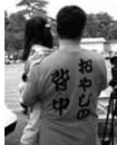
おやじの背中はたくましい！

ンプファイヤー。プロが教えるソーセージ作りは、一〇〇人も参加者が集まる大盛況でした。父親達は仕事のプロです。その力を合わせれば、活動は無限に広がります。「おやじ会をやるう」と声をあげて下さい。その声を守っているおやじ達がきつというはずは