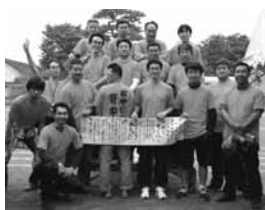
↑運動会のリレーではおやじ達から子ども達に「果たし状」が！

昨年十月、我校にも「おやじの会」を作ろうと呼び掛けました。果たしてお父さん達は集まるかなと不安な発足日、十六名のおやじ達が駆けつけてくれました。その時は、彼らが学校を助けるためにやって来た戦士の様に見えました(少し大袈裟)！まずは紙飛行機大会。春の運動会では子供・先生・おやじチームでリレーのガチンコ対決。夏休みには学校で防災訓練&テントを張ってキャ